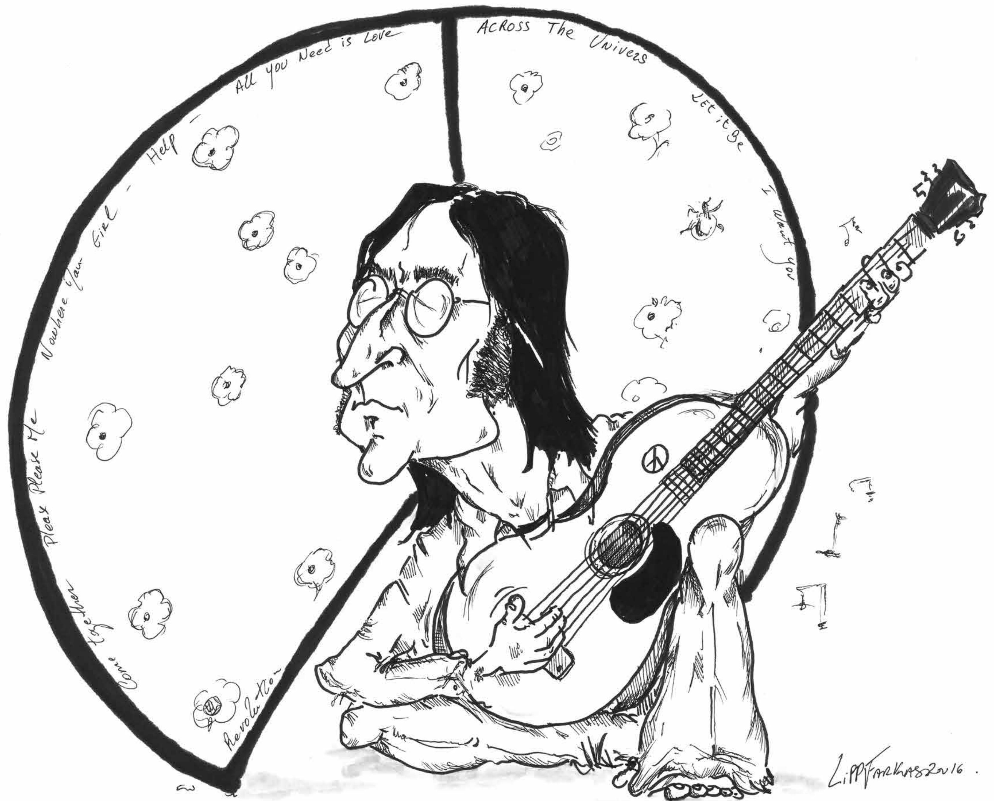
Chanteur des Beatles / Dyslexie