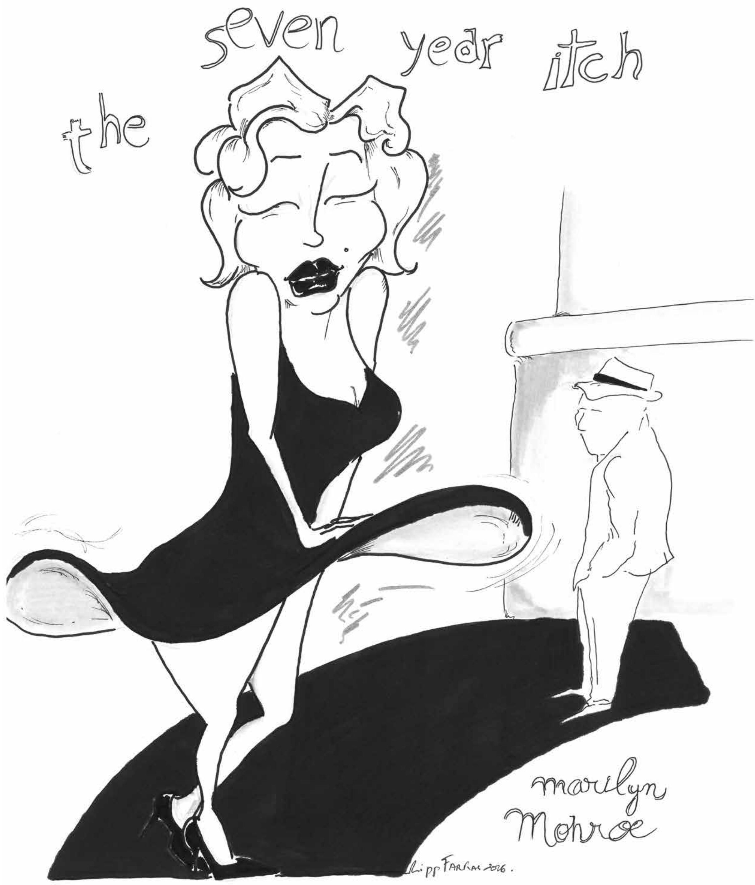
Actrice / Bégaiement